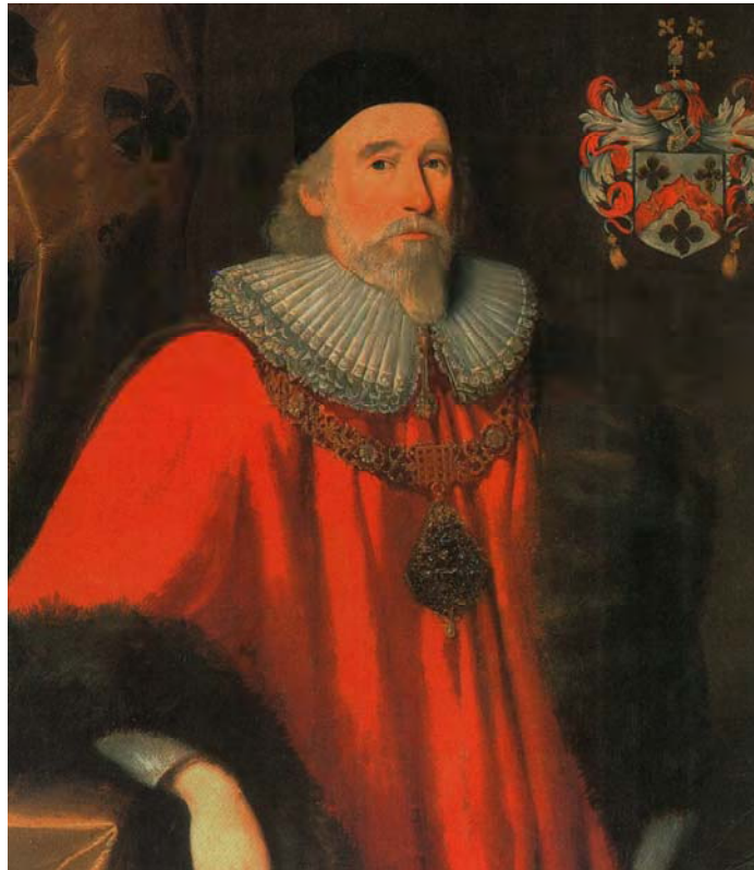
Un Mercader de Londres del Siglo XVI