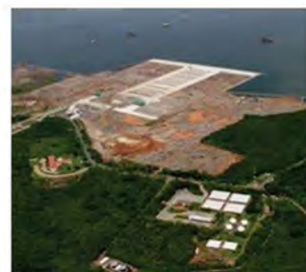
Puerto de La Unión en la Costa Pacífica, El Salvador