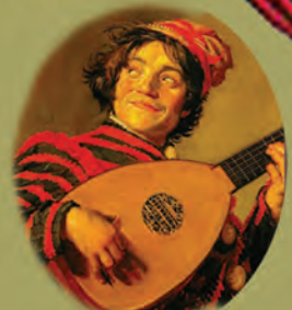
Músico del Teatro Isabelino