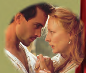
La Reina Elizabeth I de Inglaterra