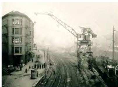
Puerto y Ferrocarril de Portugalete, España