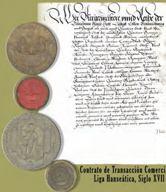
Contrato de Transacción Comercial, Liga Hanseática, Siglo XVII