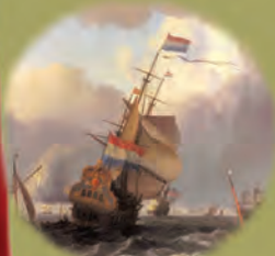
Barco de Comercio