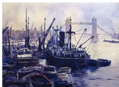
El antiguo puerto de Londres