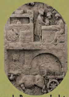
Mercado Romano en Inglaterra