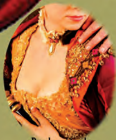
Producción de La Duquesa de Malfi de John Webster

Comercio y Drama en El Viejo Continente Siglos IX - XVII